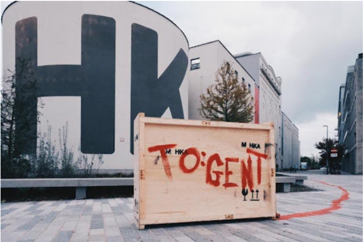
Beeld oktober, 2025